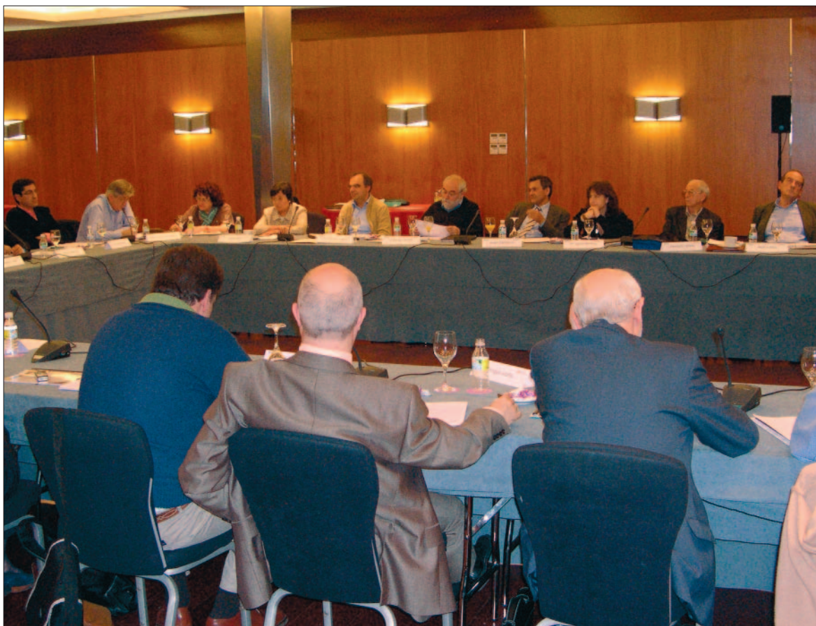
■ La metodolog a utilizada en la sesi n facilit  la participaci n.

De hecho, los primeros estudios espec ficos sobre la realidad del sector no lucrativo datan de 1992,